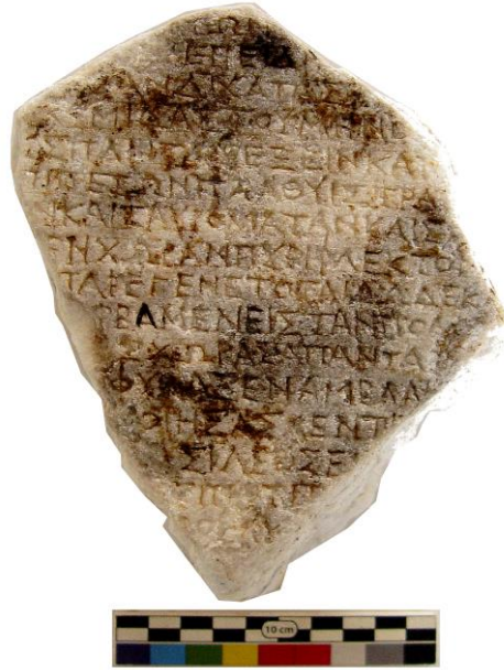
Şekil 3. MÖ I. yüzyılın ortalarına tarihlenebilen Chersonesos Yazıtı 53

“Çok sayıda [İskitler?] ve Sarmatlar ordusu saldırıp ülkeyi yağmalayıp yaktıktan sonra ... 12 [gün] ortaya çıktı. Kenti geçmek için ... ülke ... içindeki kral ... savundu, etrafına [duvara] fırlattı.” 52